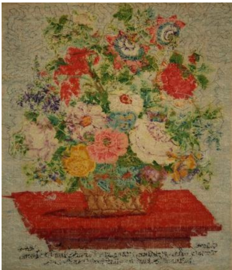
Útsaumuð mynd frá 1888, bakhlið.

Þegar áhrif ljóss á textíl- og litarefni eru metin verður að taka tillit til styrkleika ljóss og tíma sem ljósið fellur á gripinn. Ljósstyrkur er mældur með ljósmæli í einingunni lux.