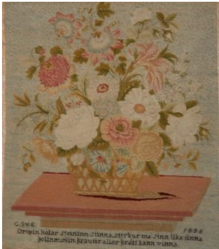
Útsaumuð mynd frá 1888, framhlið.

Textílar eru sérstaklega viðkvæmir fyrir skemmdum vegna of mikillar birtu. Ljós getur valdið niðurbroti í efnunum sjálfum og mörg litarefni upplitast hratt.