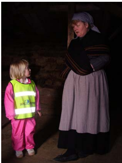
Fortíð mætir framtíð.

Innan safna hefur sums staðar skapast sú hefð að einblina á viðfangsefnið en ekki verið gefinn sérstakur gaumur að því hvernig einstaklingar læra. Í ritgerðinni fjallar höfundur um kenningar í kennslufræði sem leggja áherslu á nemandann og hvernig hann meðtekur upplýsingar. Þær kenningar sem hér eru til umfjöllunar lita á safnfræðslu sem samskipti og byggja á þeim skilningi að