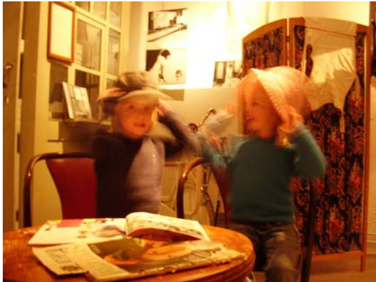
Leikið á safninu í Möndal.

gesti (Interpretation Strategy). Samkvæmt þeim er lykiltríði fyrir söfn að hafa sem mestar upplýsingar um gesti sína og nýta þær við stefnumótun og sýningagerð. 15