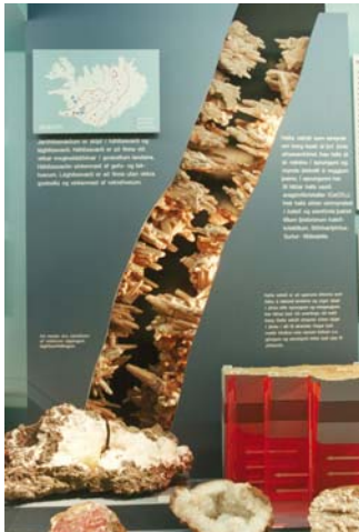
Mynd: Frá sýningu Náttúrugripasafns Ísl.

Eftir þann tíma tekur forstöðumaður Náttúruminjasafns Íslands sæti í safnaráði samkvæmt lögum þessum.“ Náttúrugripasafn Íslands, sem Náttúrufræðistofnun Íslands hefur umsjón með, er grunnur Náttúruminjasafns Íslands. Frá upphafi hafa verið settar á fót hátt í 20 nefndir sem fjallað hafa um málefni safnsins en hægt hefur þó miðað í málefnum þess. Safnið hefur aðsetur í þröngu sýningarrými í óhentugu húsnæði m.t.t. safnastarfs, við Hlemm 3-5, þar sem Náttúrufræðistofnun Íslands er staðsett. Aðgengi að sýningum er erfitt og lítið fjármagn hefur fengist til starfseminnar sem kemur m.a. illa niður á forvörslu safngripa. Auknar fjárveitingar til safnsins eru aðkallandi, svo og flutningur þess í hentugt húsnæði. Þá er aðkallandi að sett verði sérlög um Náttúruminjasafn Íslands eins og safnalög kveða á um.