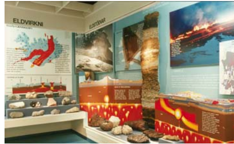
Mynd: Frá sýningu Náttúrugripasafns Ísl.

Þegar safnalög voru sett árið 2001 voru sett ákvæði til bráðabirgða í lögnum hvað varðar Náttúrugripasafn Íslands. Í bráðabirgðaákvæði segir: „Ákvæði 5. mgr. 5. gr. sem kveður á um að Náttúruminjasafn Íslands hafi stöðu höfuðsafns kemur ekki til framkvæmda fyrr en sett hafa verið sérlög um Náttúruminjasafn Íslands í samræmi við lög þessi. Náttúruminjasöfn eiga eftir sem áður rétt á styrkjum úr safnasjóði á grundvelli 10. gr. með sama hætti og önnur minjasöfn. [...] Þar til Náttúruminjasafn Íslands hefur verið sett á stofn, sbr. 5. mgr. 5. gr., skal forstjóri Náttúrufræðistofnunar Íslands eiga sæti í safnaráði og tilnefna varamann í sinn stað.“